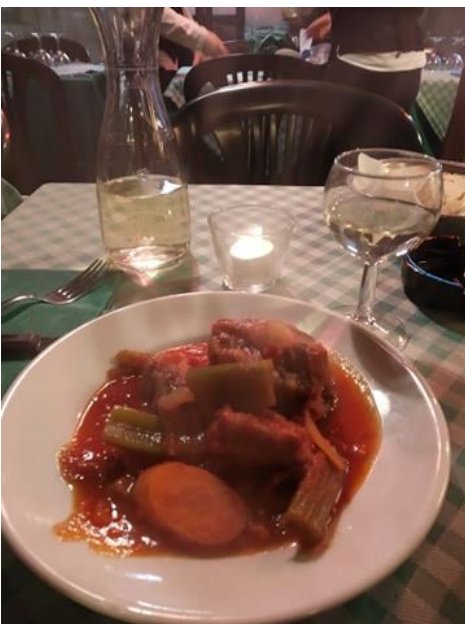
Másik helyi fogás: La coda alla vaccinara, vagyis borjú farok paradicsommártásban (sugo)