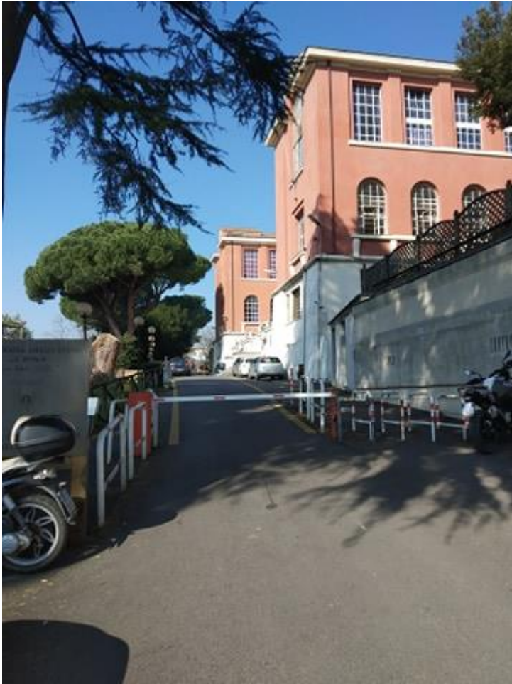
Az iskola bejárata a Borghese park mellett.