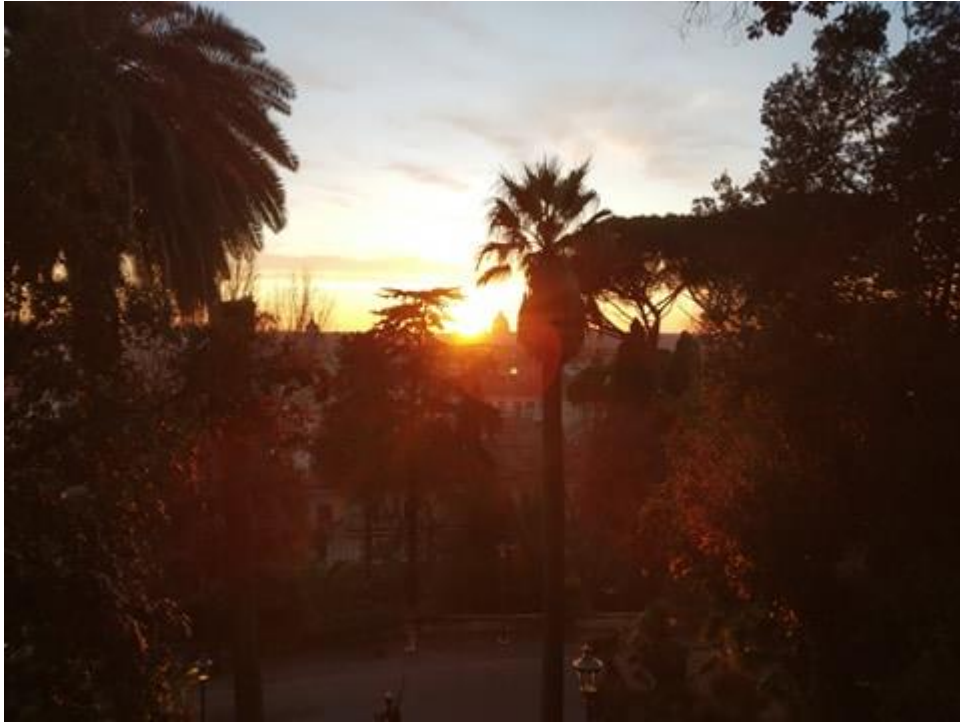
Szent Péter kupolája a téli naplementében