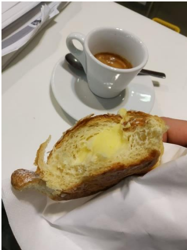
A szokásos reggelim a Bar Barberini-ben: Cornetto alla crema e un caffè, grazie!