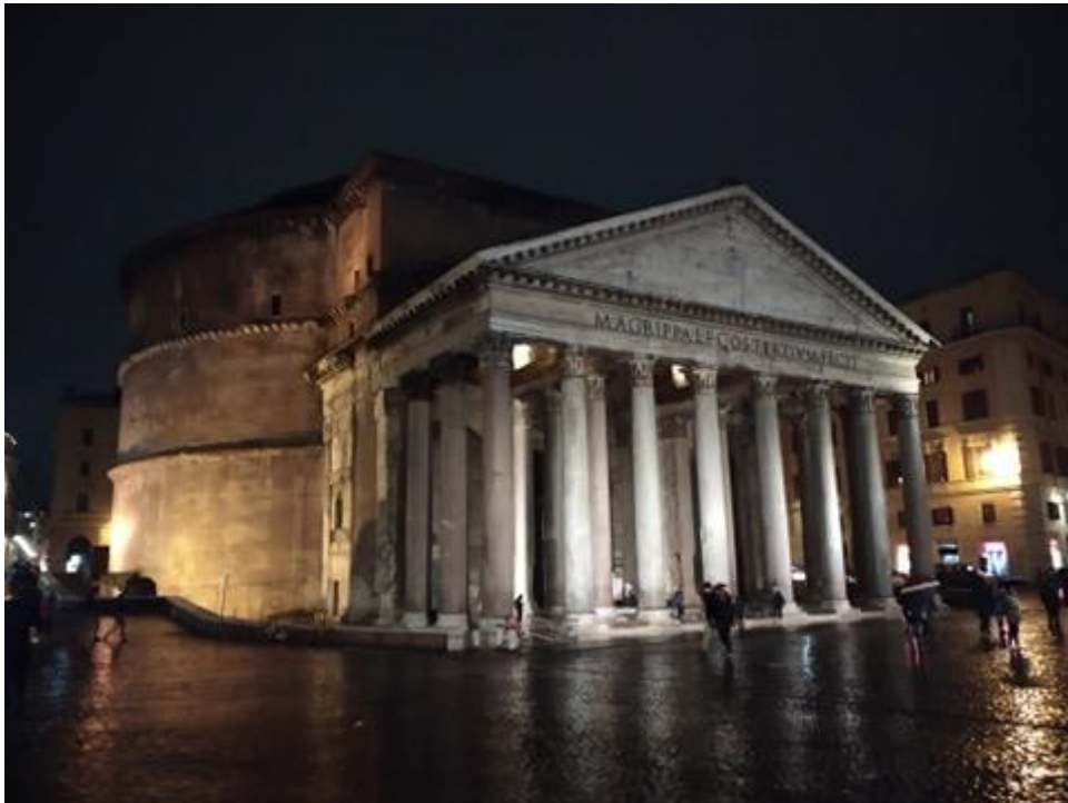
A felbukkanó Pantheon egy esti séta során.