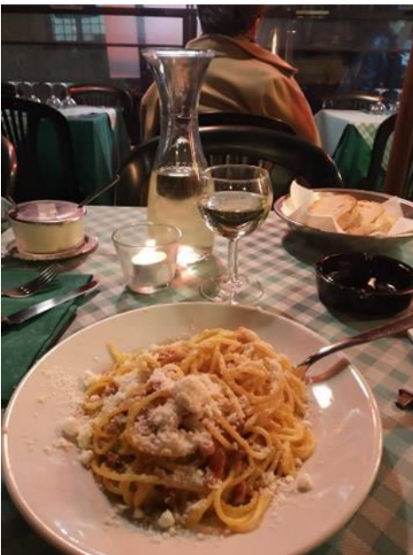
A római konyha alappillére: Carbonara