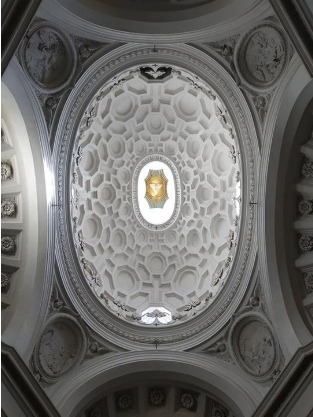
Borromini, a mester legszebb alkotása: San Carlino