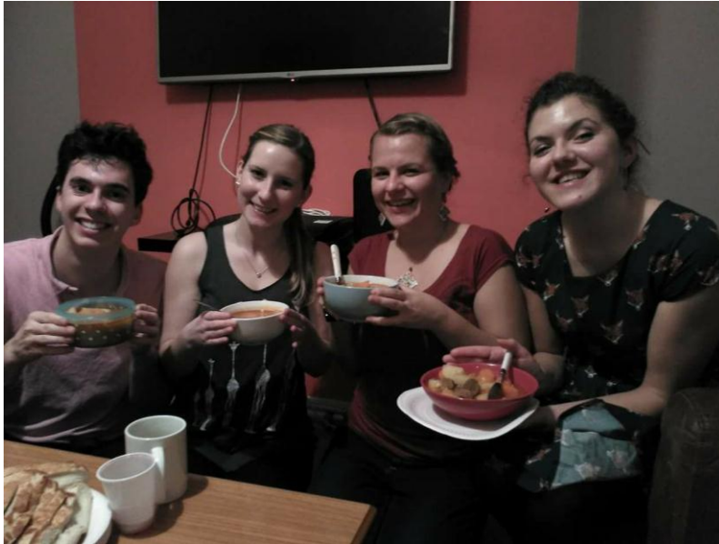
Első általam készített gulyásleves a nemzetközi barátaimmal

A legelső nehézség a kiköltözés volt. Mivel a családom maximálisan támogatott, így zökkenőmentesen ment minden. Az iskolában először nem értették, hogy melyik évfolyamhoz csatlakozom, mivel otthon osztatlan képzésen tanulok, de pár hét után kiderült, hogy melyik órákhoz is kell csatlakoznom. A legnehezebb időszak azonban karácsony után volt, amikor visszajöttem, akkor nagyon hiányzott a családom, de szerencsére akkorra már kialakult egy baráti társaság, akik átsegítettek ezen az időszakon.