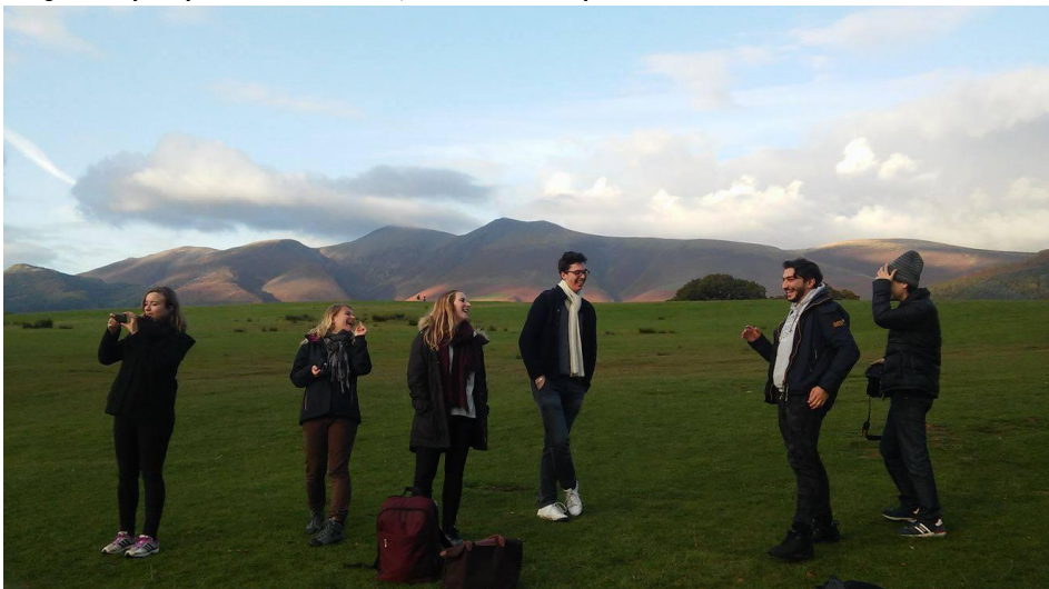
Kirándulás Lake Districtben

Azt vártam, hogy egy új várost, országot ismerhetek meg, és sok új barátot szerezhetek. Az angol nyelvtudásom fejlődése is fontos szempont volt, ezért választottam Liverpoolt, hogy az angol anyanyelvű városban, a mindennapi életben is használhassam az angol nyelvet.