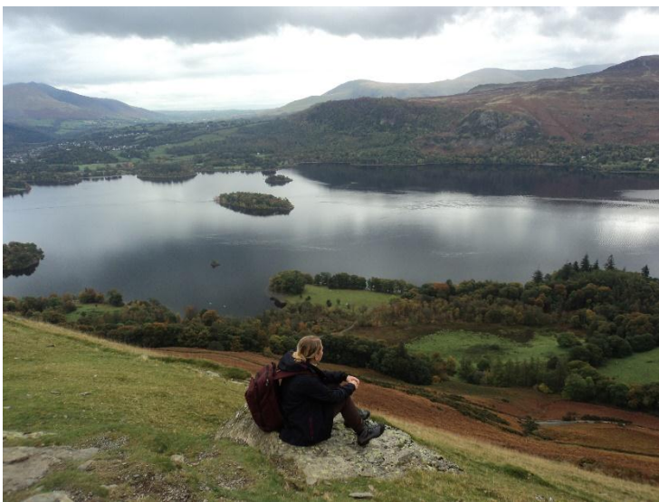
Kirándulás Lake Districtben

Az Erasmus+ programról több helyen is hallottam. Sok ismerősöm élt a lehetőséggel, és sokan meséltek nekem a kint megélt tapasztalatokról. Barátok és rokonok egyaránt. Mielőtt eldöntöttem volna, hogy jelentkezem-e, előtte részt vettem a PTE MIK kari Erasmusos tájékoztatóján és ott a hallgatók maximálisan meggyőztek, hogy megéri belevágni.