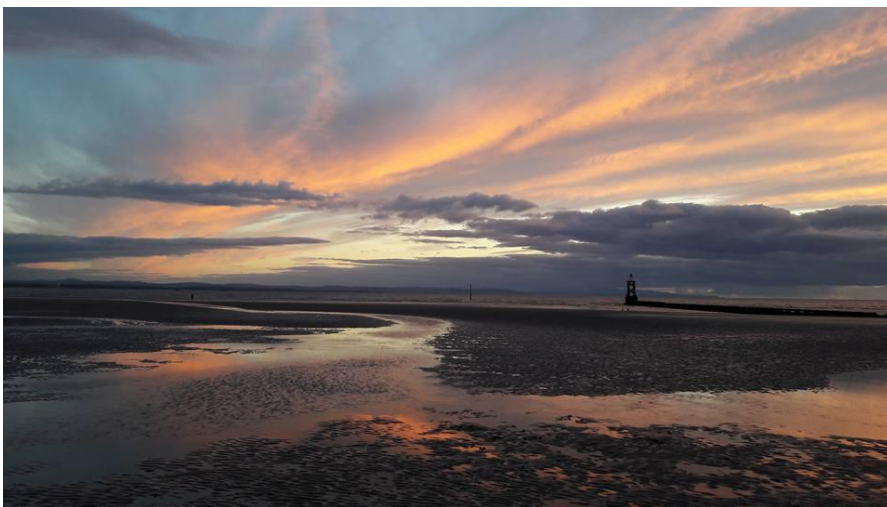
Naplemente a Crosby beachen

A fogadó intézményben mindenki nagyon barátságosan fogadott. Már az első napokban nagyon közvetlenek voltak a diákok és a tanárok egyaránt. Az első héten a tanáraink grillezést szerveztek a közeli tengerparton. Pár osztálytársammal megvártuk a naplementét. Az egyik legemlékezetesebb program kerekedett ki belőle. Később minden egyes leadás után szerveztek valamit az iskolában. Volt forraltborozás, húsvéti tojás gyűjtés, karácsonyi bál és évvégén az építész bál, ami tökéletes zárása volt az évnek.