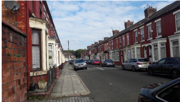
Egyforma sorházak, minden ház és minden utca ugyanolyan