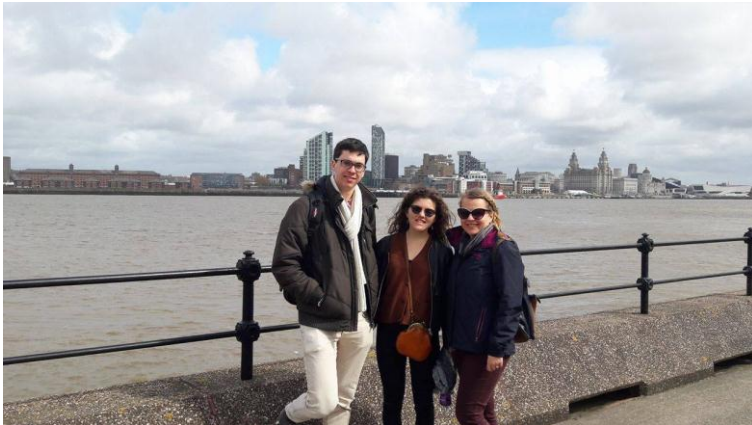
Liverpool látképe a túloldalról

Sok programot szerveznek, több diákszervezet is odafigyel a nemzetközi kapcsolatokra. Heti rendszerességgel szerveznek találkozót, illetve hétvégéken kirándulásokat diákkedvezményrel vagy diákbarát áron. Odafigyelnek a hallgatói igényre. A mentor program is jól működik, már az első héten felvették a kapcsolatot az összes diákkal.