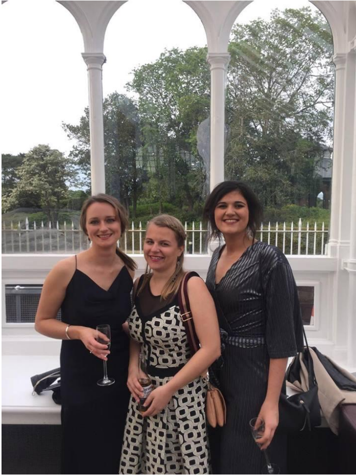
Építészbál a félév zárásaként

Mi volt a legjobb az Erasmusban? Mit adott neked a program?