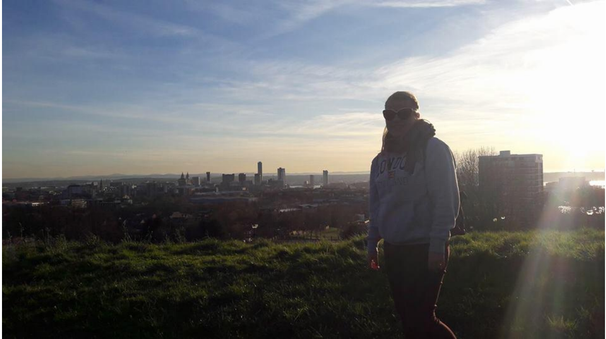
Új-régi otthonommal a háttérben: Liverpool

Szerintem mindenki kétségekkel indul neki egy Erasmusos félévnek. Én sem voltam biztos magamban, hogy lesz-e honvágyam, vagy, hogy tudok-e majd barátokat szerezni. De bátran állíthatom, hogy a legemlékezetesebb és legszínesebb évet zártam, amire majd emlékezhetek, és amiből majd tölthetők, amikor új kaland elé nézek.