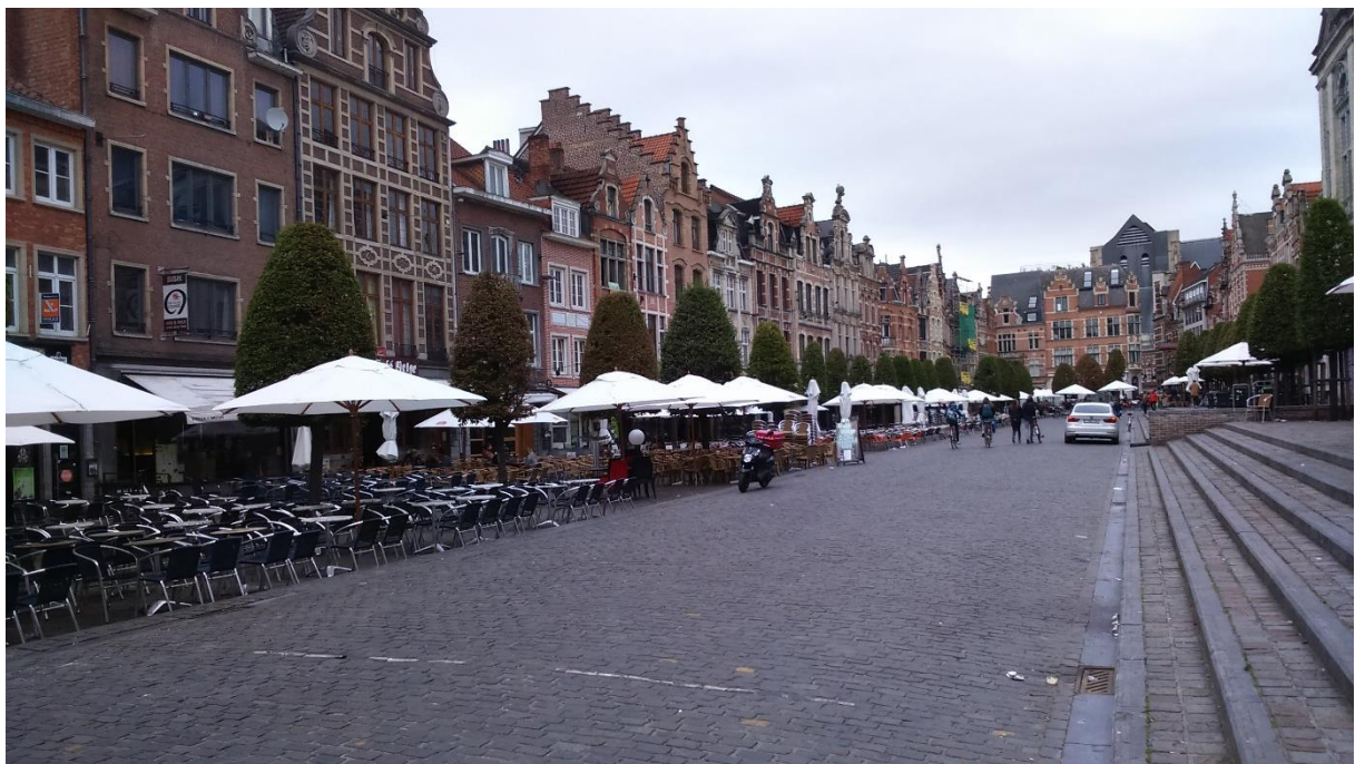
Leuven. Oude Markt