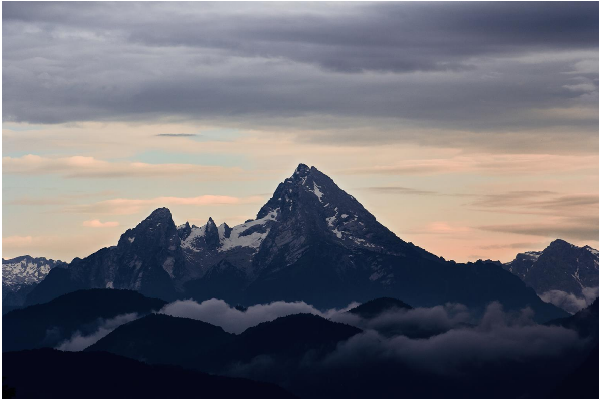
3. Ábra: 45 perc séta ezért a látványért? IGEN!!!

Egyszerű hétvégi program még elmenni az Untersbergre. Busz ide is megy (meg is áll a kollégiumokhoz közeli megállóban) kb. 25 perc a buszút és a hegytetőre menő felvonó aljában áll meg, amire jár a diák kedvezmény ( http://www.untersbergbahn.at/ ).