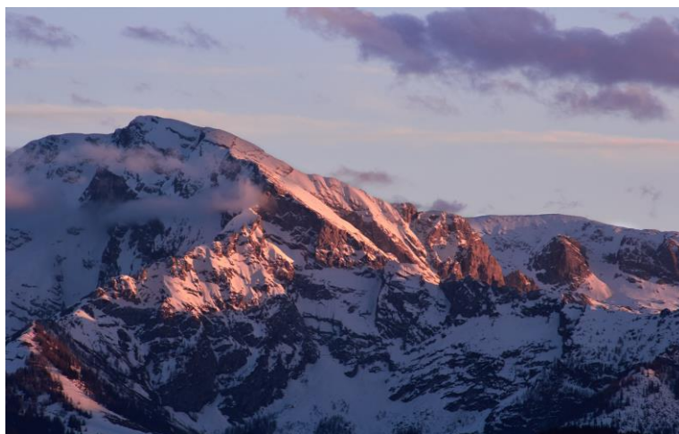
1. Ábra: Untersberg, a városban szinte mindenholnan látszik

Ezt a legőszintébben gondolom, különösen mivel ez előtt egyszer már erősen kacérkodtam a gondolattal és ugyanúgy Salzburgba akartam menni akkor is. Azonban, különösen visszatekintve, nemes egyszerűséggel megrémültem a lehetőség nagyságától. Először elképzelve minden csak egy hatalmas murinak tűnik és csak a pozitívat látja az egészben az ember, aztán jön a mellbevágó realizálása annak, hogy egy ilyen kaland milyen sok szervezéssel és felelősséggel jár. Első körben ez a feladat nagyobbak bizonyult nálam, de újra nekivágtam és ezúttal nem hagytam senkinek és semminek, hogy kétséget ébresszen bennem aziránt, hogy meg tudom ezt csinálni... és sikerült!