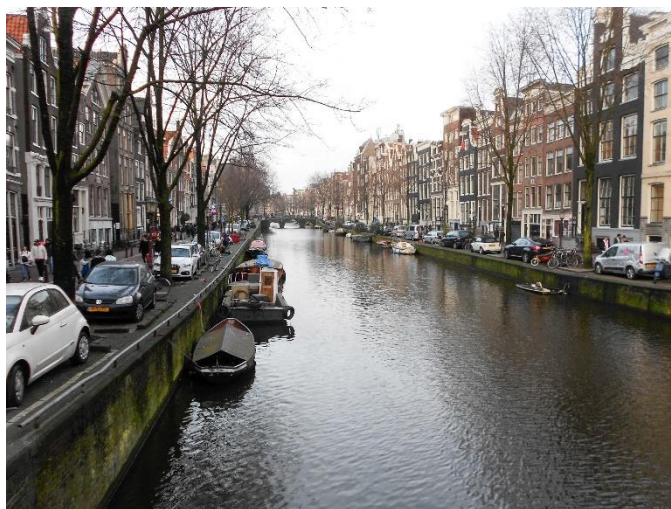
06. kép: Amsterdam