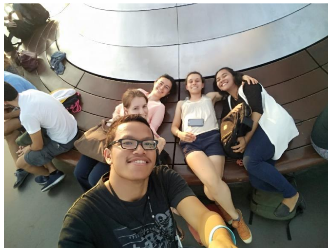
08. kép: Barátokkal