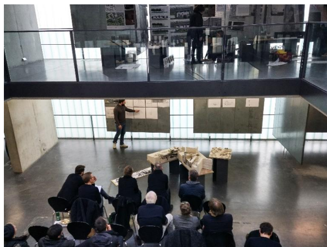
03. kép: Diploma prezentáció