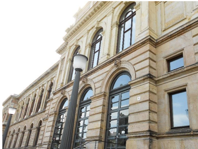
01. kép: Technische Universität Braunschweig