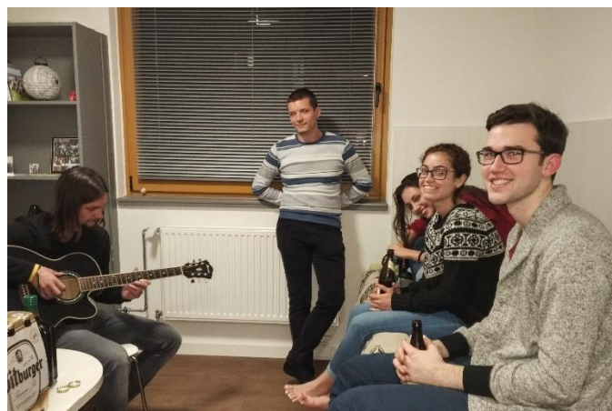
09. kép: Barátokkal