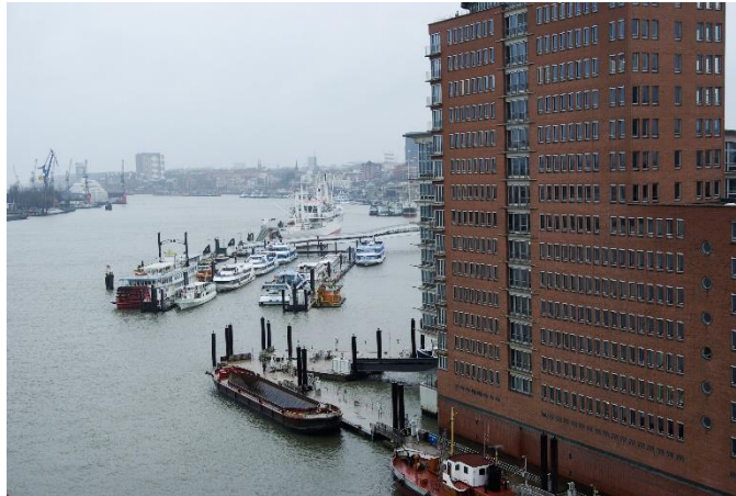
04. kép: Hamburg