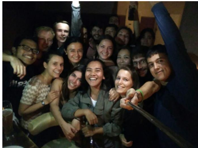
07. kép: Barátokkal