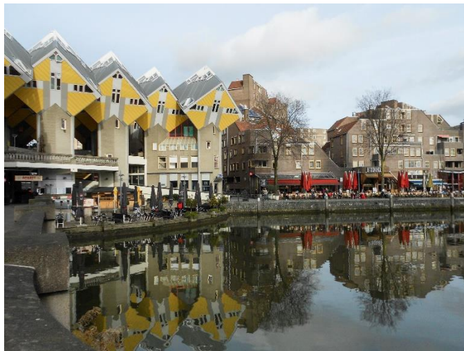
05. kép: Rotterdam