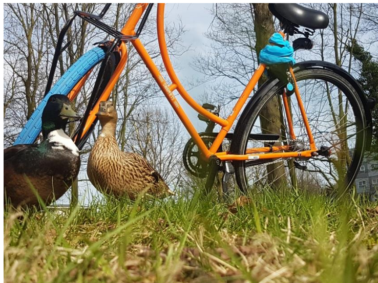
2. ábra - A folyóhoz közeli előnyök

csésze teával menteni a helyzetet, hogy a hektikus tanterv során ne maradjak ki sok mindenből, mert az a kapcsolati tőke, ami itthon meg volt, az kint még nem alakult ki a kezdetekben, így a kimaradás is fájdalmasabb volt, meg amúgy is hiányzással kezdeni egy új országban a tanulmányokat kicsit rizikós is. Amit mindenképpen rakjatok be a bőröndbe, ha Hollandiáról van szó, az az esőálló szerelések mindenféle változata. Eleinte nagyon sokat esett, így mindig jó, ha kéznél van egy esőkabát, egy, az időjárásra alkalmas cipő, esernyő, stb. Nem utolsó sorban egy olyan telefonos applikáció is mindig jó, ha kéznél van, mely 1-2 órára bár, de kijelzi az esőzés mértékét, hosszát, így tudod, hogy mennyit kell még kihúznod a tető alatt, mielőtt hazabringázhatnál.