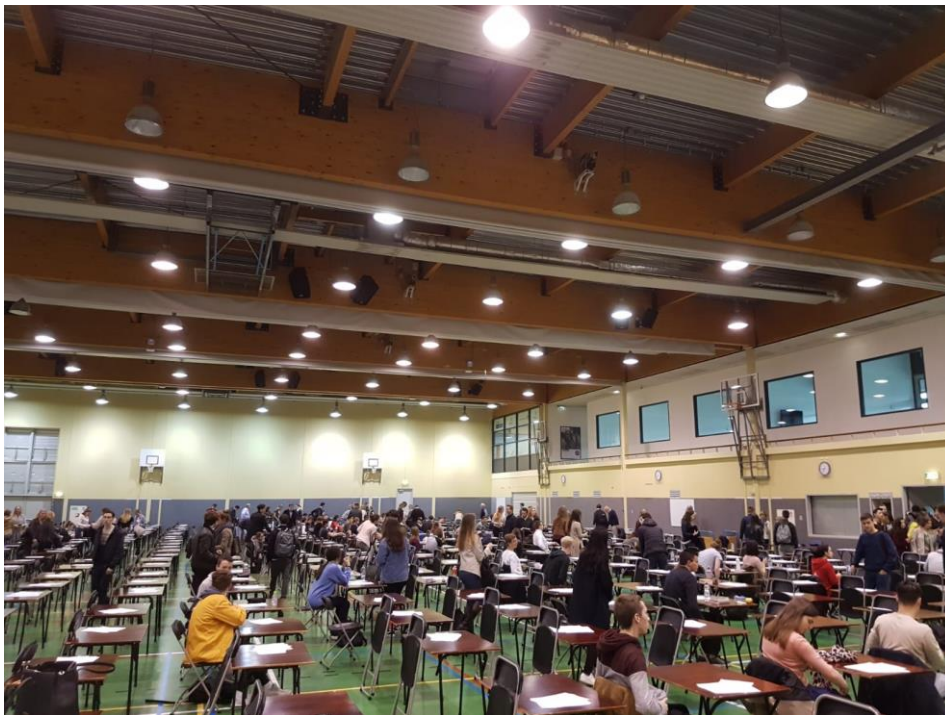
5. ábra - Egy nagyobb vizsga

Az egyetem, ahova jártam – Radboud University – egy igencsak erős (kiutazásom időpontjában 122. legerősebb egyetem a World University Ranking alapján), diákközpontú egyetem. Rengeteg emaillel és értesítéssel jelezték, hogy bármi problémám adódik, nyugodtan forduljak hozzájuk, megoldást tudunk találni. Az oktatást a magas színvonal jellemzi: az