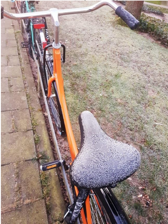
3. ábra - A téli nehézségek

Biciklizés. A kerékpár egy nagyon király tömegközlekedési eszköz: környezettudatos, nagyon mobilis, könnyen és gyorsan el tudsz jutni a kívánt célponthoz, olcsó – ami egy diák számára nem kis kvalitású szempont – és nem utolsó sorban egészséges is. Magyarországon is szerettem ezt a fajta közlekedést használni, de a dolgot megfűszerezte két dolog is. Az egyik, hogy nem voltam hozzászokva ahhoz, hogy napi szinten 10-20 kilométereket kell lebicikliznem a mindennapi kötelezettségeimhez, a másik pedig, hogy -7^{\circ}\text{C} -ban is ugyanúgy felülök a biciklimre és az előbb említett távolságokat letekerem. Ehhez egy olyan ruházat szükséges, melyben nem fagyok meg, amikor ráülök a már-már fagyott – igen, kb. ez a szint – nyeregre, de a hosszú és sietős – mert persze késésben voltam mindig – bicikliút során pedig nem is izzadok ki túlságosan, mert akkor ugye azért fázok meg. Szóval majdnem minden kezdeti nap ilyen ruházkodási, túlélési taktikákkal indult. Az eső is rengeteget esett, amikor megkezdtük tanulmányainkat, így sokszor egy buliból, vagy az iskolából bőrig elázva érkeztünk haza. Ezt követően mindig próbáltam egy-két meleg