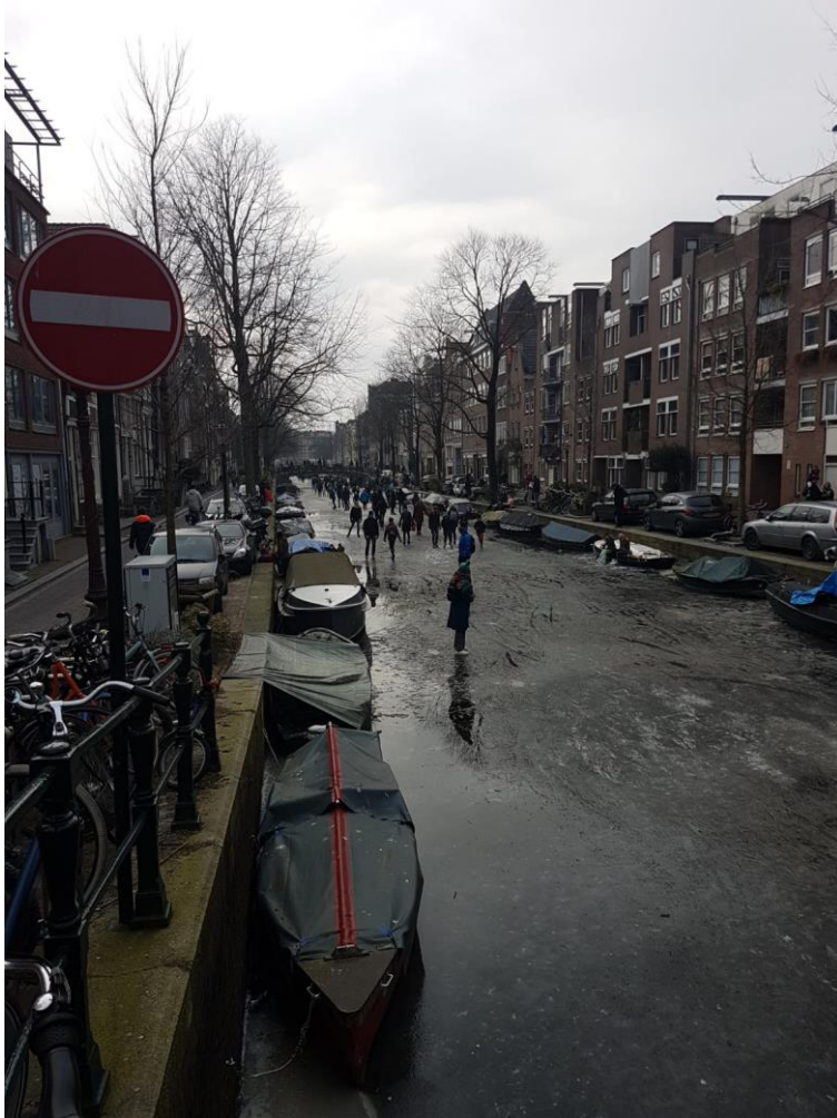
4. ábra - Amszterdam mindig pezseg

van szükségünk és gyorsan helyre is igazít bennünket, hogy aztán tovább folytathassuk utunkat. A tömegközlekedés viszont külföldi emberek számára igencsak borsos, barátságtalan áron történik. Körülbelül 20 eurót kellett fizetnem minden vonattal való utazásomért. Általában nagyobb városokba mentem: Amszterdam, Eindhoven, Utrecht, Rotterdam, Hága. A 20 euró egyébként csak az odautat foglalja magában, tehát ha vissza is szeretnénk térni otthonunkba, cirka 40 eurós díjjal kell számolni. Diákkedvezmény sajnos számunkra nincs, ha viszont csoportosan utazunk, ez esetben egy holland bankszámláról való vétel során csoportos jegyet tudunk vásárolni, amivel jóval lejjebb tornázhatjuk az utazás árát, a feltétel viszont, hogy mindig együtt kell tartózkodni a csoportunkkal.